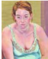
Variationen des Wartens - Nina 2007, Acryl / Holz, 100 x 80 cm