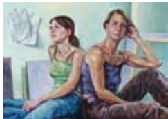
Rückenstärkung 2007, Acryl / Nessel, Holz, 100 x 140 cm