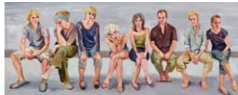
Variationen des Wartens - Junge Menschen, 2009, Ölskizze auf Holz, 40 x 100 cm