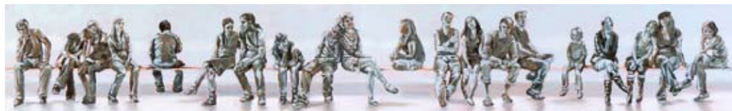
Variationen des Wartens, 1. Fries 2009, Tusche, Öl, Eitempera / Holz, 30 x 200 cm