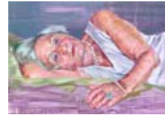
Rosis Ring 2007, Acryl / Holz, 80 x 122 cm