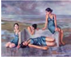
Zwischen Himmel und Erde 2007, Acryl / Leinwand, 155 x 190 cm