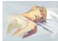
Ende des Wartens I 2008, Vor-Ort-Ölskizze / Pappe, 38 x 42 cm