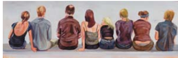
Variationen des Wartens - Junge Menschen, Rückenansicht 2009, Ölskizze auf Holz, 32,5 x 100 cm