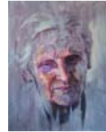
Johanna geht I 2009, Acryl / Holz, 100 x 80 cm