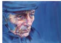
Gehen 2006, Acryl / Holz, 70 x 100 cm