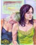
Variationen des Wartens - Jenny 2008, Acryl / Holz, 100 x 80 cm