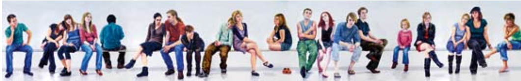
Variationen des Wartens, 1. Fries Öl / Holz, 155 x 1000 cm, 2009