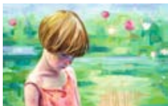
Kleine Lotta 2009, Öl / Nessel, 70 x 110 cm