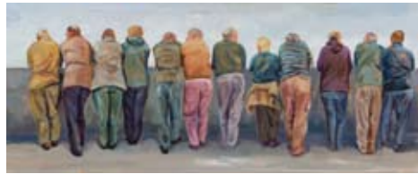
Variationen des Wartens - Rückenansicht 2009, Ölskizze auf Holz, 40,5 x 100 cm