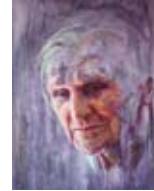
Johanna geht II 2009, Acryl / Holz, 100 x 80 cm