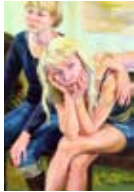
Variationen des Wartens - Anna 2007, Acryl / Holz, 122 x 80 cm